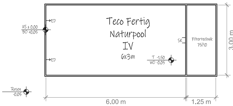
Teco-Fertig-Naturpool ohne Poolumrandung